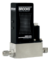
5850E 系列 模拟热 MFC

设备设计紧凑, 只需一台即可测控多种气体和流量, 最大限度地提高工艺灵活性和生产力, 同时保持精确度。