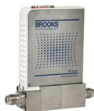
MFCs thermiques à scellement métallique

Éliminez les variations de pression - droop, boost et hysteresis - de votre procédé grâce au contrôle en boucle fermée de nos régulateurs de pression numérique.