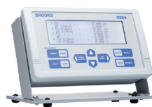
Série 0250 Alimentation, lecture et contrôle du point de consigne

Sous-système autonome pour la distribution de vapeur d'eau ultra-haute pureté.