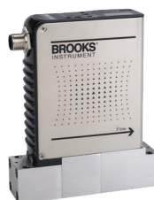
P-MFC à joint métallique de la série GP200

Le temps de réponse ultra-rapide et le chemin d'écoulement entièrement en métal de haute pureté minimisent la contamination et améliorent le rendement.