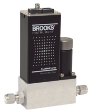
Série SLA MFCs thermiques à usage général

RDM largement éprouvé pour une grande diversité de besoins et d'applications, très performants et coût d'utilisation très faible.