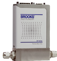
Série GF40 MFC thermiques MultiFlo™

RDM largement éprouvé pour une grande diversité de besoins et d'applications, très performants et coût d'utilisation très faible.