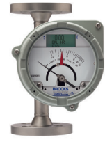
Débitmètres à flotteur tout métal série MT3809

Les plus larges plages de température, de pression et de débit pour la mesure des fluides dans les zones dangereuses et éloignées.