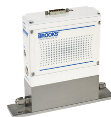
MFC Quantim® Coriolis

Notre MFC le plus avancé, le GP200, est le premier P-MFC entièrement insensible à la pression, avec une approche de conception unique permettant de délivrer le gaz de procédé avec une précision optimale dans la plus large gamme de conditions de fonctionnement.