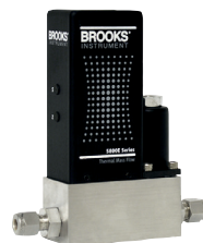
Série 5850E MFC thermiques analogiques

RDM avec possibilités Multi-Gaz et Multi-Gammes offrant flexibilité et précision dans un encombrement compact.