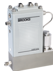
Série SLAMf MFC thermique IP66

RDM pour des application purement analogiques.