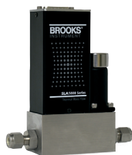
Régulateurs de pression à joint élastomère de la série SLA

Éliminez les variations de pression - droop, boost et hysteresis - de votre procédé grâce au contrôle en boucle fermée de nos régulateurs de pression numérique.